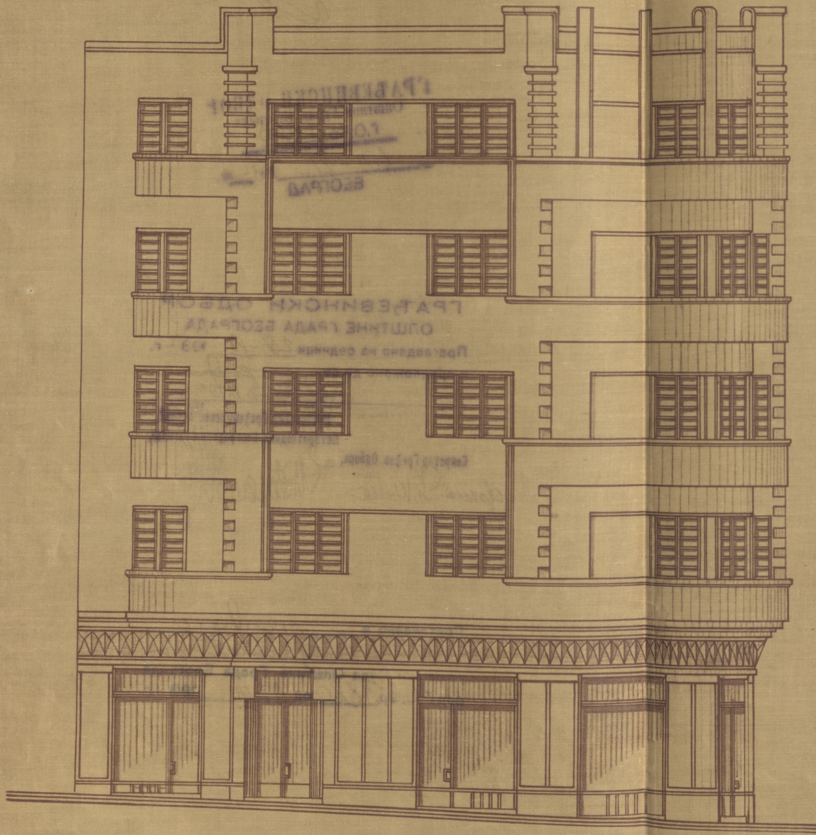
Изглед из Косовске улице